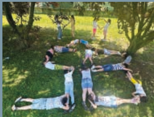
Le alunne e gli alunni della redazione compongono la scritta 5B

plesso, che ci ha visto occupati nella redazione in maniera rigorosa e, al tempo stesso, divertente ed entusiasmante. Abbiamo fatto fronte ad alcune difficoltà come i tempi stringenti e gli imprevisti che ci hanno condotto a trovare alternative. Nonostante questo, è stata un'esperienza unica e fortemente formativa. In conclusione di questo percorso ci sentiamo soddisfatti e fieri del lavoro svolto solo con le nostre forze e determinazione, piacevolmente stupiti del prodotto finale che ci ha lasciato senza parole e arricchiti dal punto di vista didattico e, soprattutto, dal punto di vista umano e relazionale. Abbiamo sempre creduto nelle nostre capacità, ma stavolta abbiamo davvero superato noi stessi! Arrivati alla fine della scuola primaria, anche grazie a questa esperienza, abbiamo capito che ognuno di noi è prezioso e può fare tanto, ma che uniti si può dar vita a qualcosa di ancora più grande!