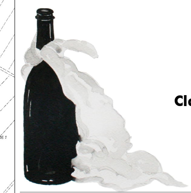
tavola RUE/Ta Classificazione del territorio urbanizzato e del territorio rurale

a cura di Arch. Carla Ferrari Consulenti e collaboratori: Ivan Pozzati Giulia Gadda