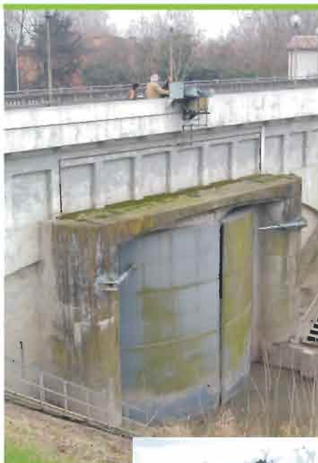
Alcuni momenti della chiusura manuale ed elettrica dei portoni vinciani, in periodo di magra.

La prova è consistita nella chiusura manuale ed elettrica degli stessi, avvenute entrambe con esito positivo; oltre a verificare la pulizia del letto del fiume in corrispondenza dei portoni e delle scarpate arginali.