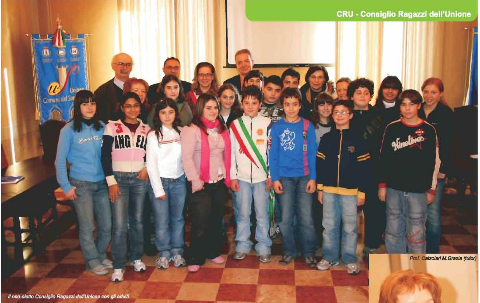
Il neo-eletto Consiglio Ragazzi dell'Unione con gli adulti