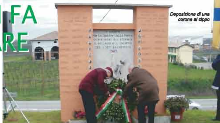
Deposizione di una corona al cippo

Oltre a numerosi Sindaci dei Comuni confinanti e la partecipazione dell'On.le Manuela Ghizzoni, erano presenti tutte le Associazioni storiche dei Partigiani, degli Ex Combattenti e Reduci della nostra Provincia.