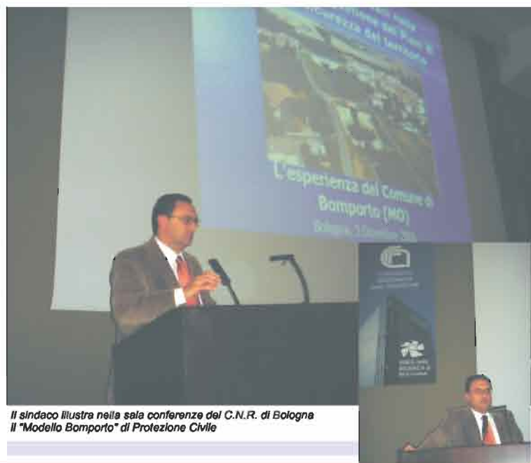
Il sindaco illustra nella sala conferenze del C.N.R. di Bologna il "Modello Bomporto" di Protezione Civile

A scuola era bravino, ma chi avrebbe pensato che da Sindaco sarebbe andato al Consiglio Nazionale delle Ricerche a Bologna per parlare della criticità idraulica del nostro Comune e delle soluzioni proposte!? Ebbene sì. Una delegazione del nostro Comune con in testa il Sindaco ha partecipato ai lavori del seminario sul tema: "Il ruolo del Sindaco nella pianificazione e nella gestione dei piani di messa in sicurezza del territorio". Nel corso dell'illustrazione si è parlato della esperienza maturata sul nostro territorio in tutti questi anni, consapevoli che non basta farsi trovare impreparati e che ogni evento non è mai uguale ad un altro. Con tre figlie giovani studentesse questo per il Sindaco è un bel jolly.