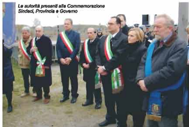
Le autorità presenti alla Commemorazione Sindaci, Provincia e Governo