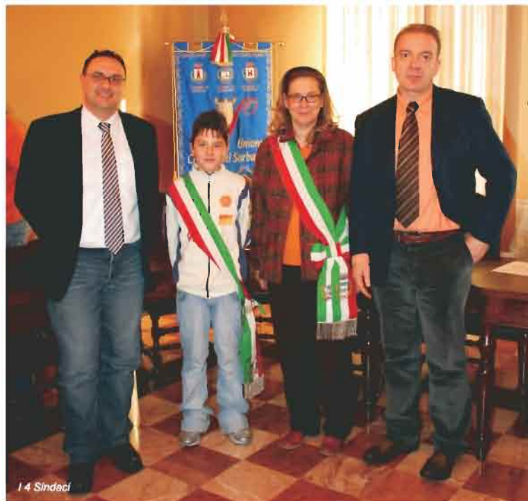
I 4 Sindaci

Progetti e idee chiare illustrate agli adulti del consiglio del Sorbara.