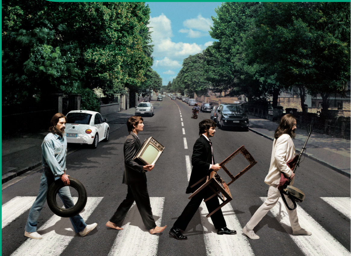
edizione aprile 2017 stampato su carta ecologica - design: Koan multimedia