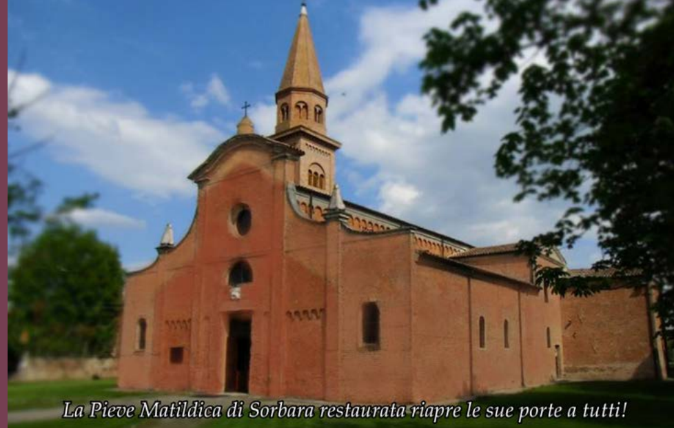
La Pieve Matildica di Sorbara restaurata riapre le sue porte a tutti!

È stato un autunno di inaugurazioni per Sorbara, con due opere significative finalmente completate e consegnate alla comunità. Si tratta della nuova pista ciclo-pedonale di via Verdeta, che mette in collegamento Sorbara e Bastiglia, e della storica Pieve Matildica di Sant'Agata, simbolo identitario del paese. Realizzata in cinque mesi, da febbraio a giugno 2019, con un investimento di 350mila euro, la pista ciclo-pedonale di via Verdeta è intervenuta a migliorare la viabilità del territorio. La scelta di realizzare l'opera nasce infatti dall'esigenza di completare un percorso di utilità quotidiana, inserito nel territorio, che agevola gli spostamenti dei cittadini verso attività commerciali e servizi, favorendo una mobilità alternativa e sostenibile tra i centri di Sorbara e Bastiglia. I lavori hanno interessato anche l'illuminazione pubblica, sia nel tratto di nuova realizzazione che nella porzione di ciclo-pedonale tra il cimitero di Sorbara e via Barbieri, con lampade a LED "intelligenti" (durante la notte la luminosità si abbassa per risparmiare energia). Lungo il tracciato, inoltre, sono state posizionate otto aree di sosta attrezzate con panchine e cestini per la raccolta differenziata,