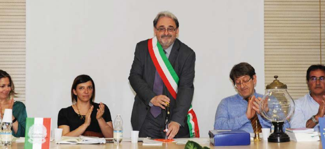
Il Sindaco Angelo Giovannini nel momento del giuramento